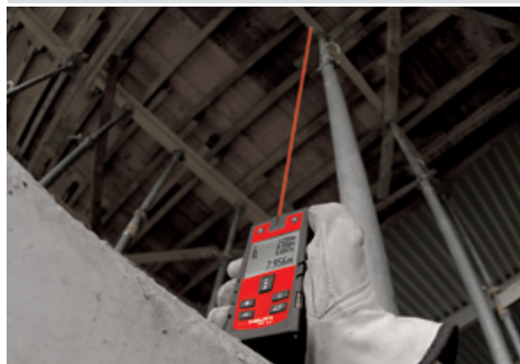
Medición de alturas de techos y encofrados.