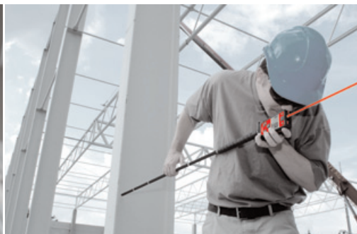
Construcción de acero: alineación exacta de pilares de vigas de acero utilizando la extensión de medición y el visor óptico.