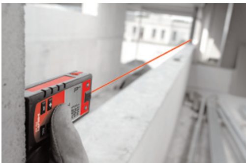
Instalación de ventanas: medición de longitudes y anchuras para la colocación de marcos.